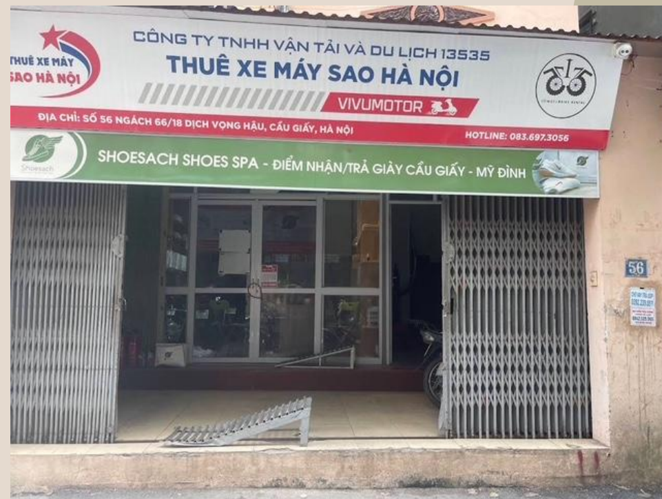
お店：Shoesach Shoes Cleaning